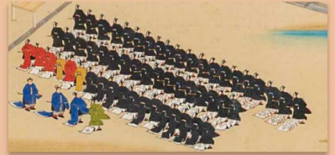
小朝拝東庭参列之図(部分) 『公事録』附図