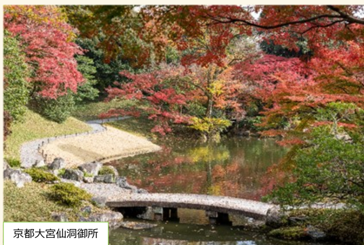
京都大宮仙洞御所