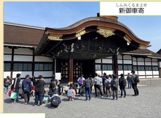
京都御所見学時の様子