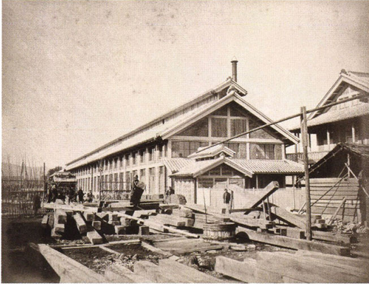
49-4 富岡製糸場の図五 (繰糸所)