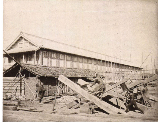
49-3 富岡製糸場の図六 (東置繭所)