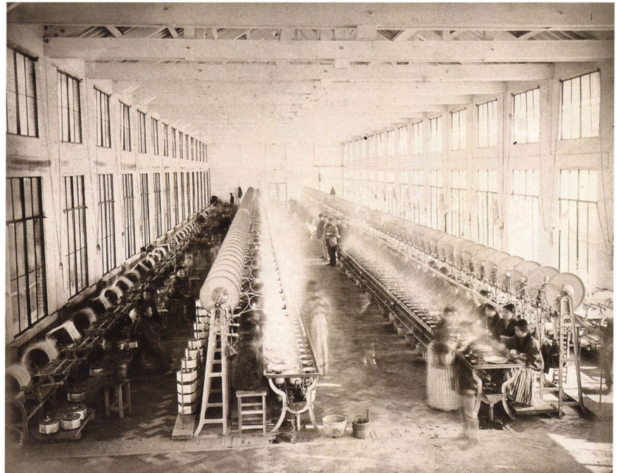
49-5 富岡製糸場繰糸の図 (中央二列に繰糸器、その両端に揚返器を配す)