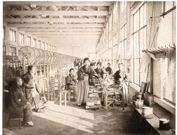
49-8 富岡製糸場器械の図二