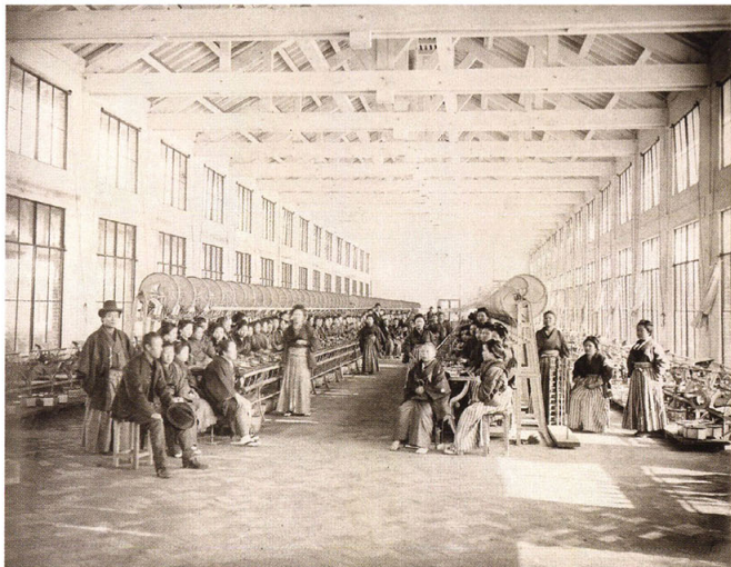
49-9 富岡製糸場器械の図四