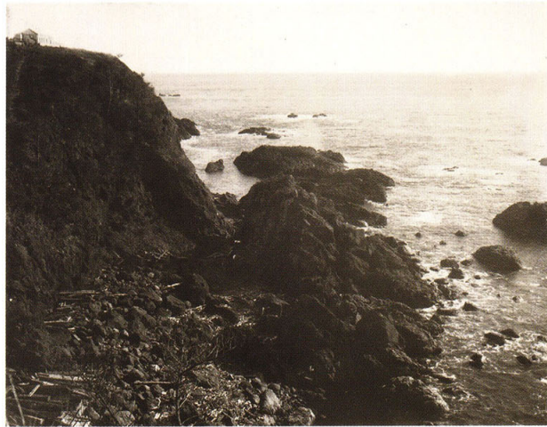
46-4 トルコ国軍艦難破場所を望む