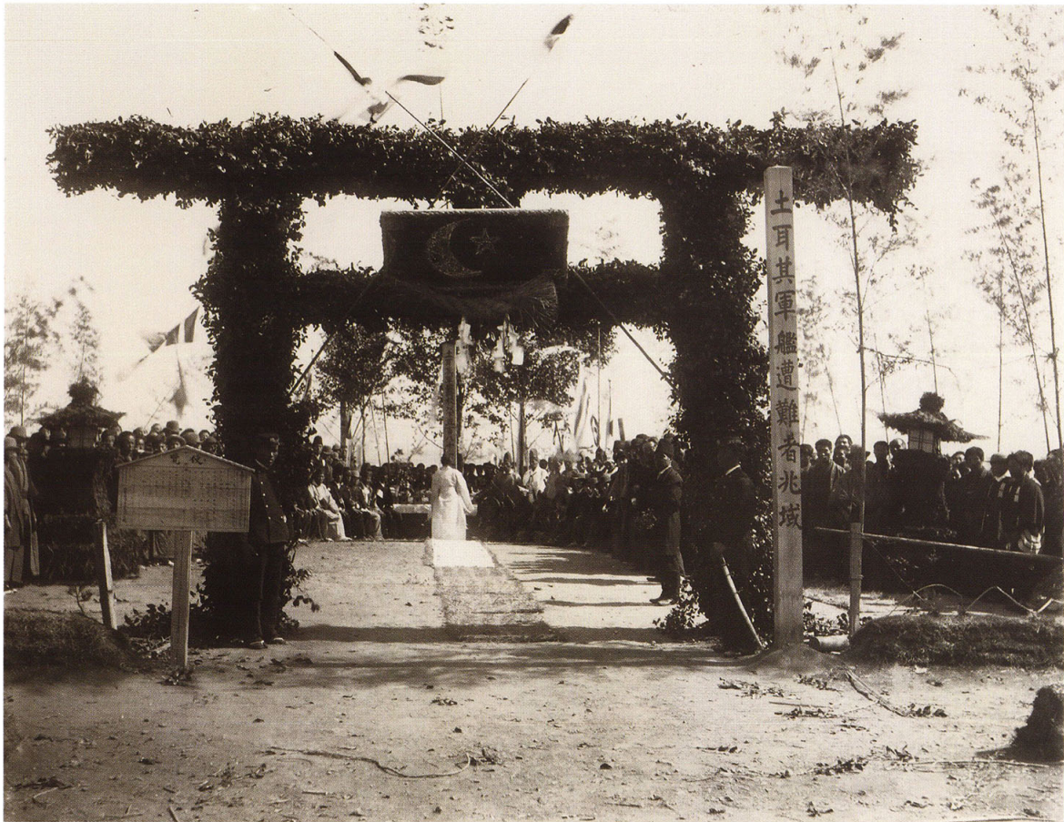
46-1 トルコ国軍艦遭難者慰霊祭(1)