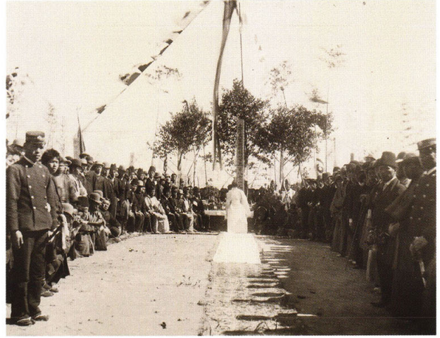
46-2 トルコ国軍艦遭難者慰霊祭(2)