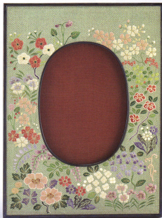
50-14 刺繡写真立 春・秋 渡邊松華、黒田橘邨 一対 絹、刺繡 各24.2×18.1