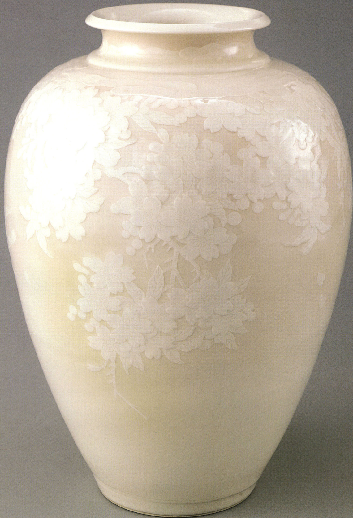
2 | 三代清風與平 《旭彩山桜花瓶》 明治三十八年（一九〇五）