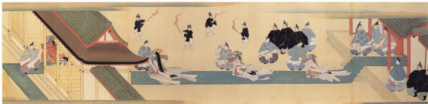
11 承安五節舞絵巻 大正4年