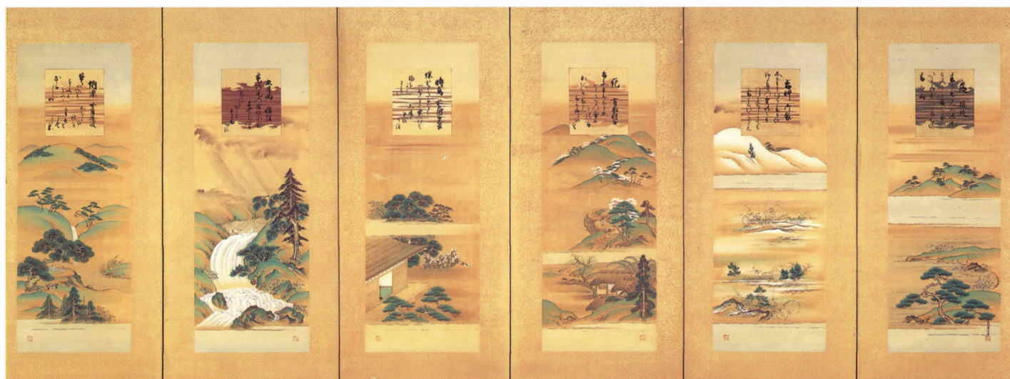
10 四季絵屏風(俊成卿九十賀屏風) 住吉広行 江戸時代(18~19世紀)