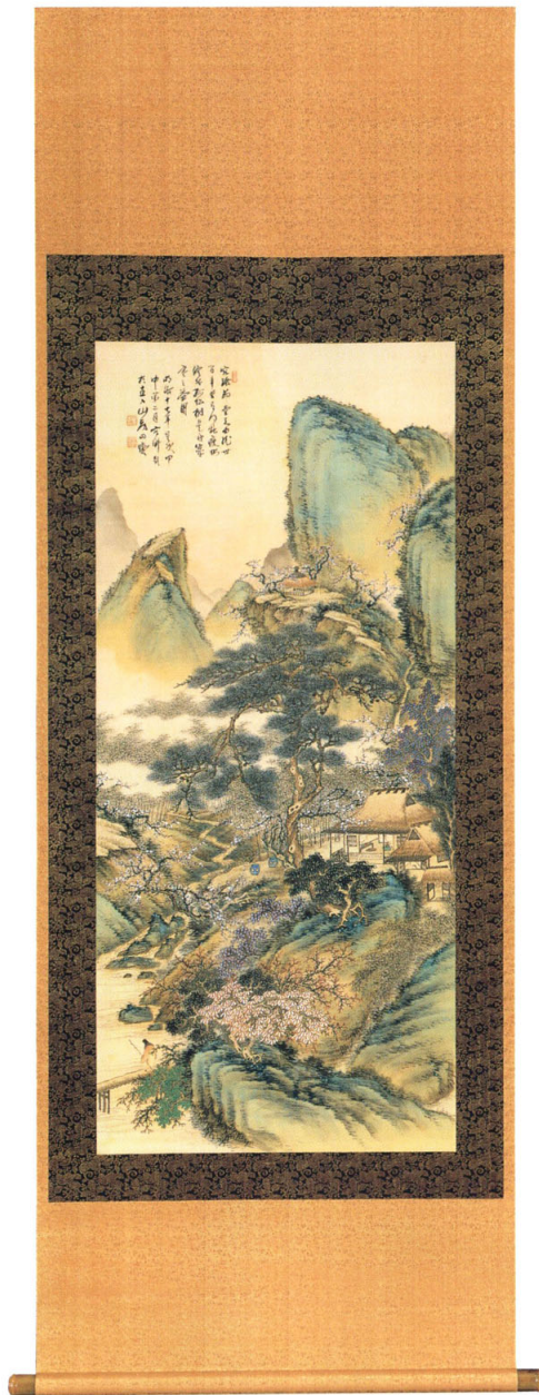
20—田能村直入《梅花書屋之図》一幅 明治17年(1884) 絹本着色 128.4×56.6