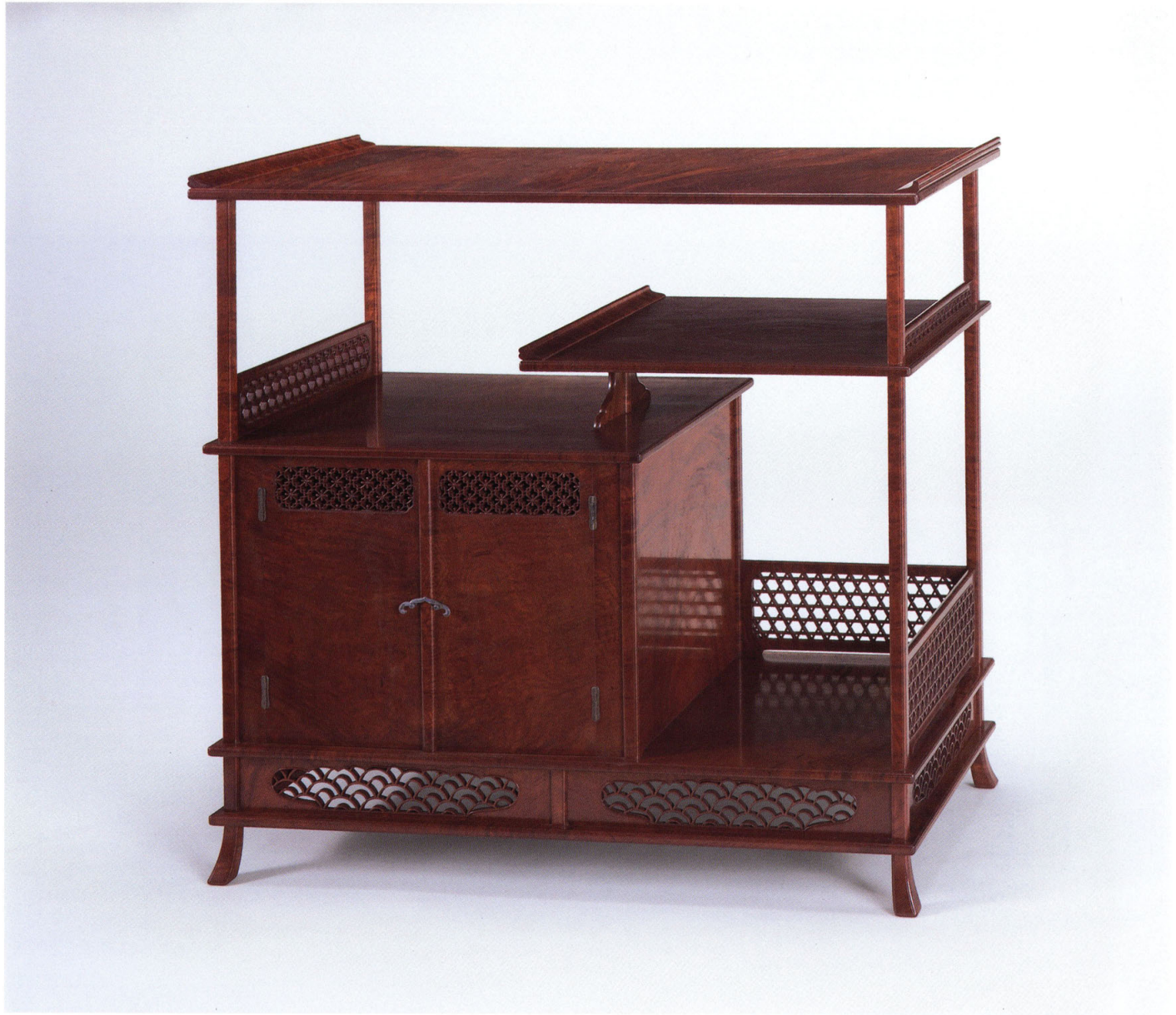
2—東京 桑木地透彫棚 前田南齊 大正4年(1915)頃