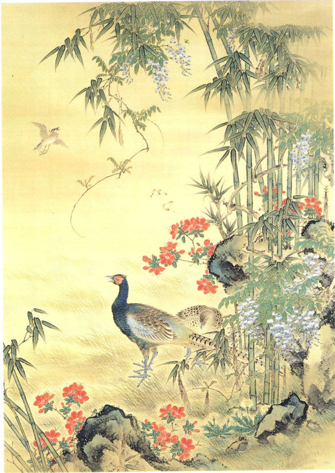
18 瀧 和亭 《花鳥図》 明治二十年代末