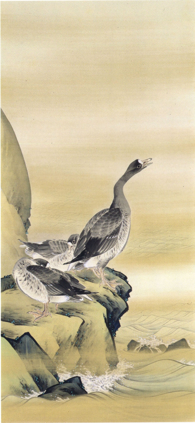
10 村瀬玉田 《波二雁図》 明治期