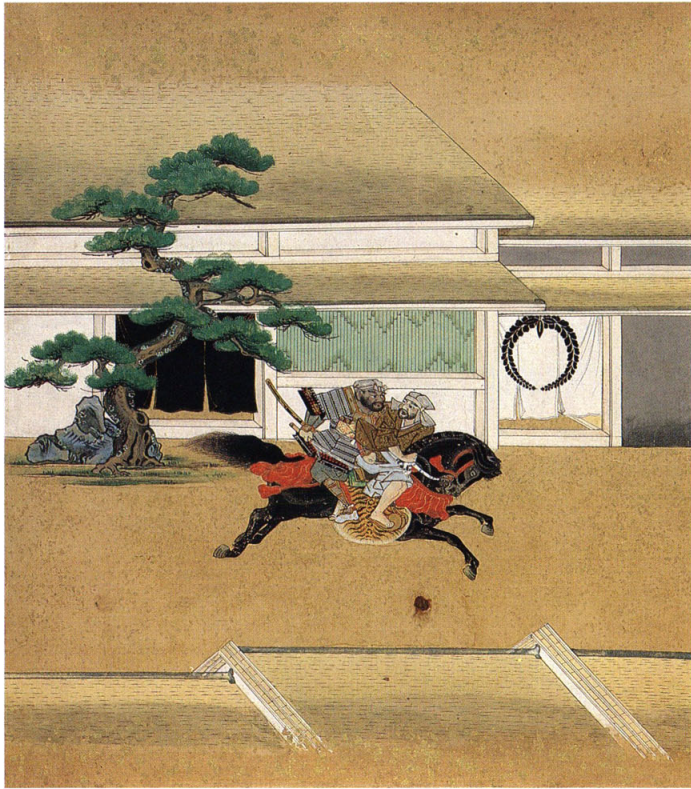
弁慶、土佐坊を馬に乗せ、堀川館へ向かう 絵6