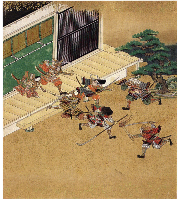
義経、静御前と共に、夜討ちをかけた土佐坊と戦う 絵9