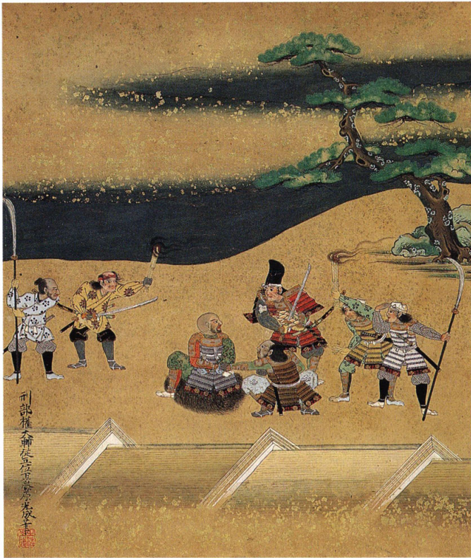
生け捕られた土佐坊、六条河原で斬られる 絵12