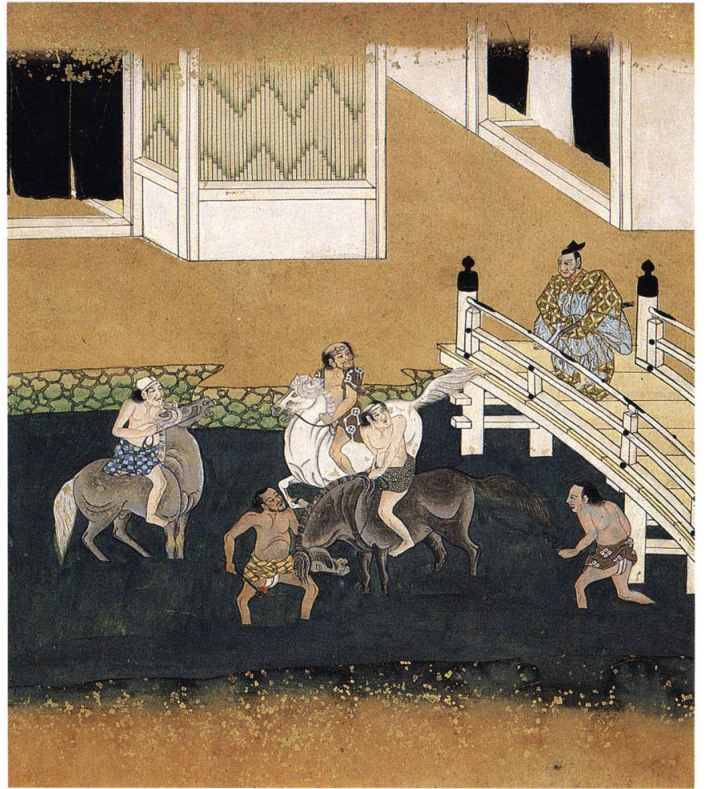
戦いに備えて馬の足を冷やす雑色たち 絵2