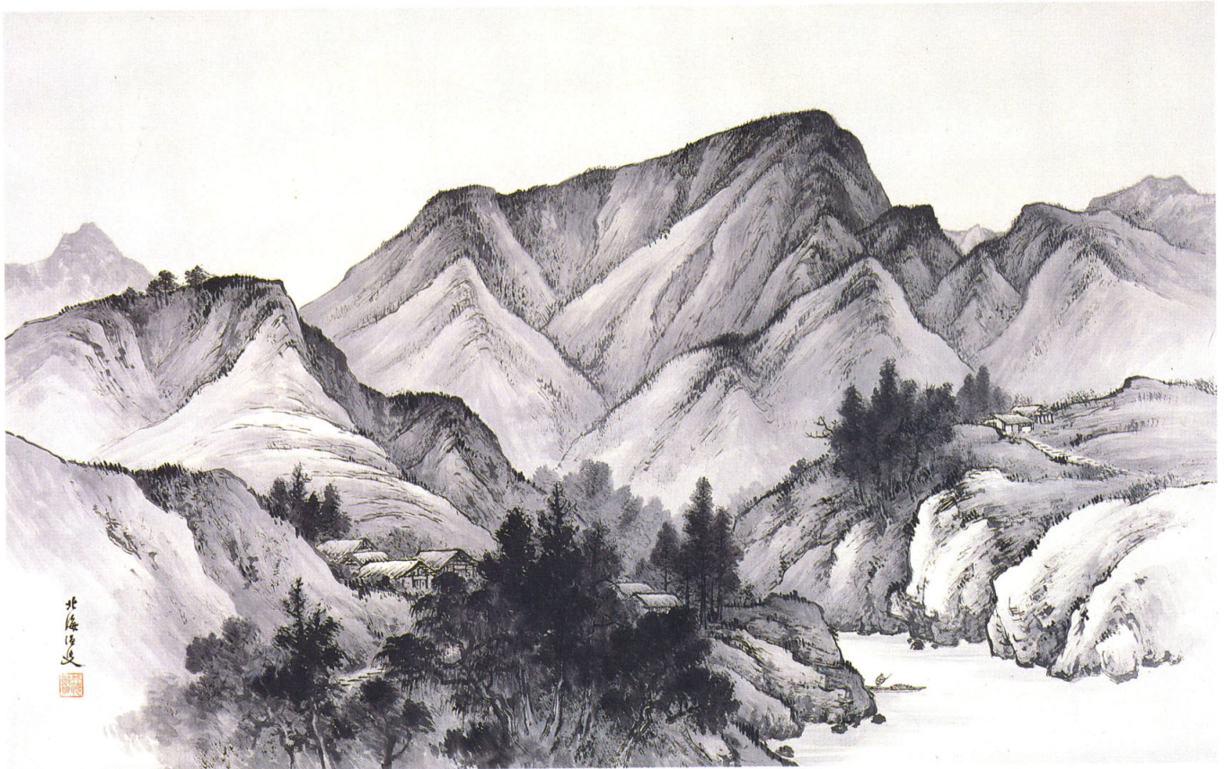
24 高島北海 《積翠》 大正3年(1914)