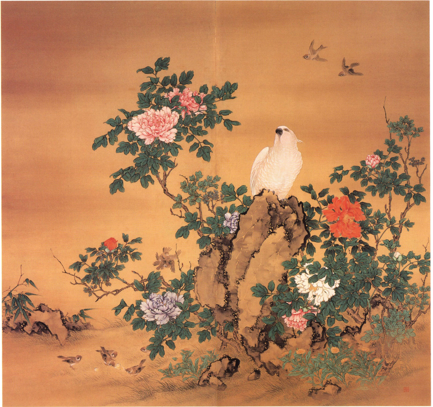
30 澆 和亭 《孔雀鸚鵡圖》 明治20年代