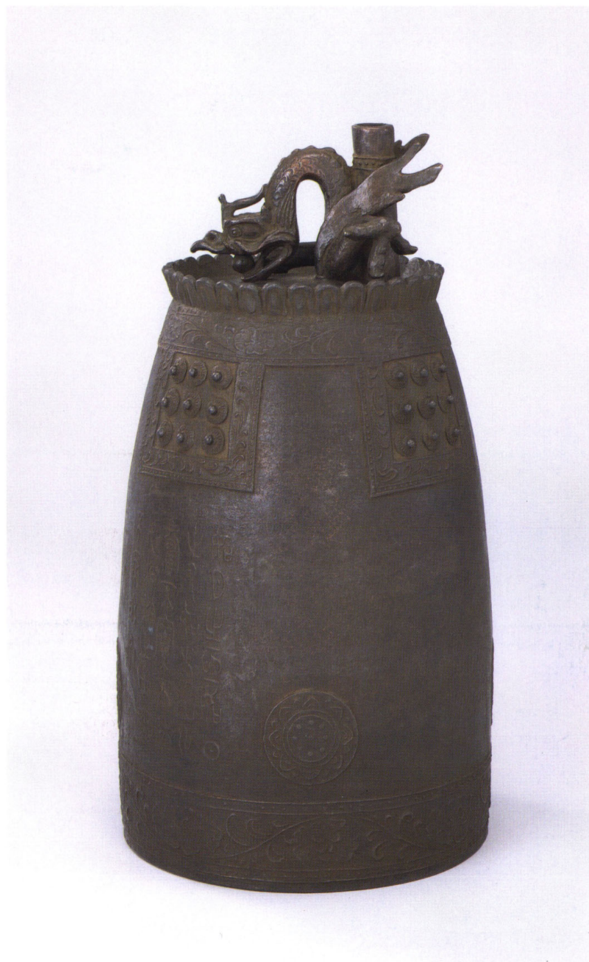
31 岡崎雪聲 〈青銅鐘〉 明治45年(1912)