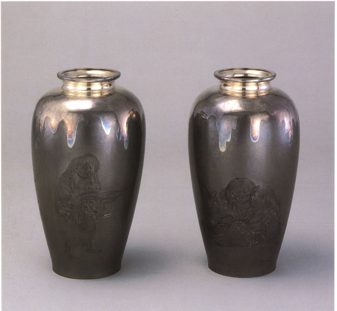
18 海野勝珉 〈臙銀猩々囃花瓶〉 一對 明治42年(1909)